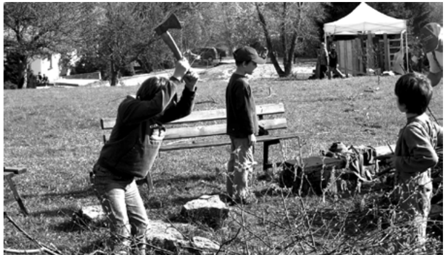
Die Hulakanufen beim Holz hacken

Wir haben ein großes Spiel gebaut – für die ganze Schule. Dabei haben die Kinder Verantwortungsgefühl