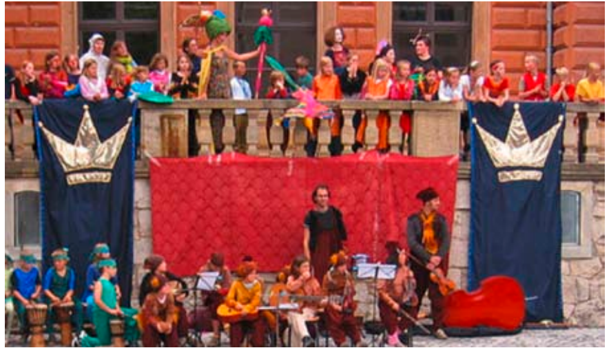
Eltern und Kinder gemeinsam in der Zirkusband

Seit Oktober 2007 arbeite ich nun regulär an der Schule. Ich habe mit Unterstützung der Lehrerinnen und der Direktorin einen Entspannungsraum eingerichtet, den Kinder gern besuchen, wenn sie müde und erschöpft sind vom Unterrichtsalltag.