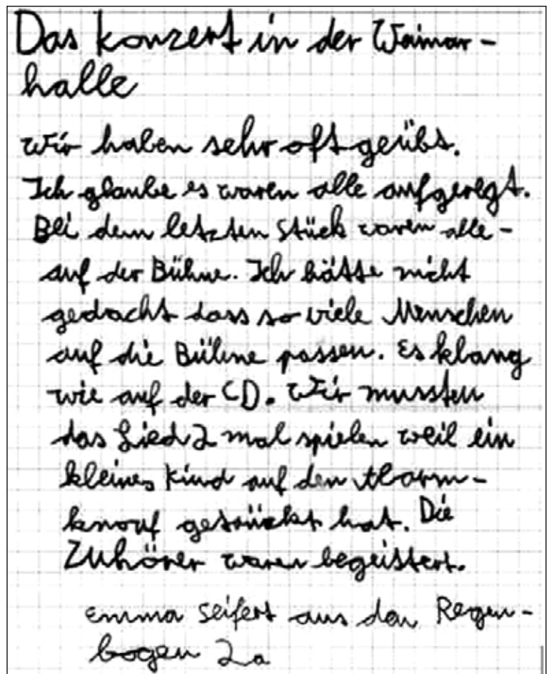
Ein kleiner Kinderbericht über ein großes Konzert

Musik lernen durch Musik machen, moto­rische, kognitive und kommunikative Fähigkeit schulen, die Kreativität fördern, gemeinsam Spaß am Musizieren haben, Auftritte in und außerhalb der Schule – das möchten wir jedem Kind ermöglichen.