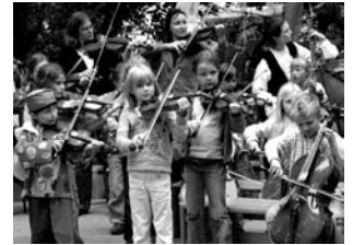
Eltern-Kinder-Auftritt beim Zirkusprojekt

Wir fördern dadurch in erheblichem Maß die Sozial­kompe­tenz der Kinder und ihre Leistungen in anderen Bereichen. Vor allem für Kinder aus sozial schwachen Familien