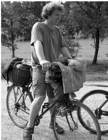
Auch die Geschwisterkinder sind mit dabei

Das Schuljahr eines Delfins der Jenaplanschule wird von drei Ausflügen umrahmt. Beginn und Abschluss bildet eine Stammgruppenfahrt. Zum Sommeranfang wird allerdings an einem Wochenende ein Wochenendausflug mit Eltern unternommen.