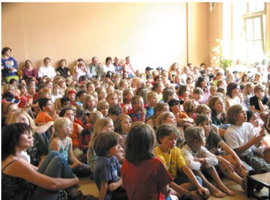
Wochenabschlussfeier in der Aula