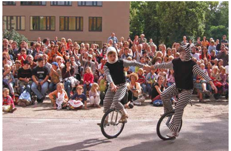
Zirkusprojekt im Sommer 2007

Der Förderverein Jenaplan schule Weimar e. V. hat dieses Projekt finanziert in Zusammenarbeit mit dem Kinder- und Familienzirkus Tasifan.